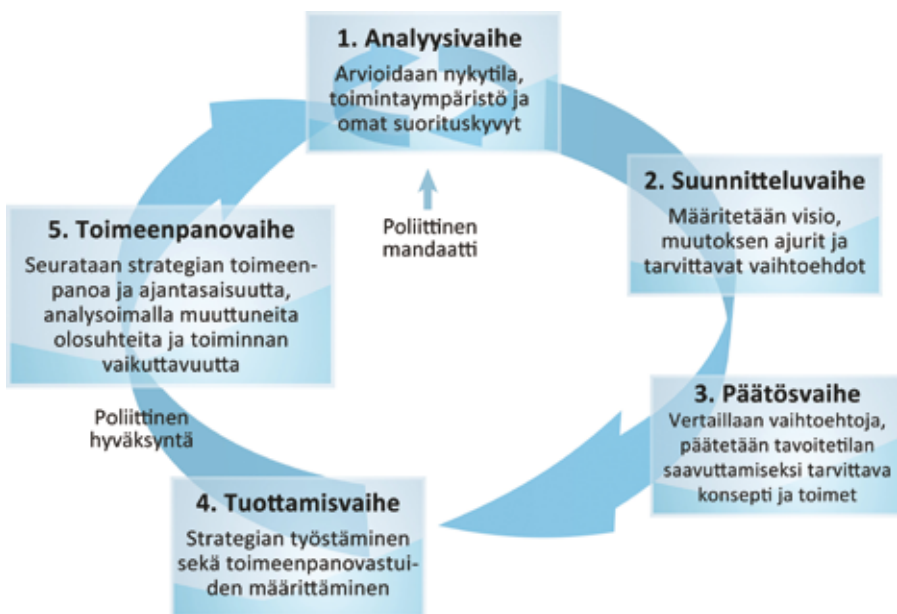
LIITTEEN KUVIO 1 Kyberturvallisuuden jatkuvan kehittämisen prosessi

Kyberturvallisuusprosessi edustaa jatkuvan kehittämisen mallia, jossa seurataan muuttuvia olosuhteita ja toiminnan vaikuttavuutta ja niiden perusteella tehdään analyysyjä ja tarvittaessa päivitetään strategiaa.