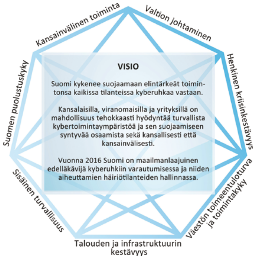
KUVIO 1 Kyberturvallisuuden visio